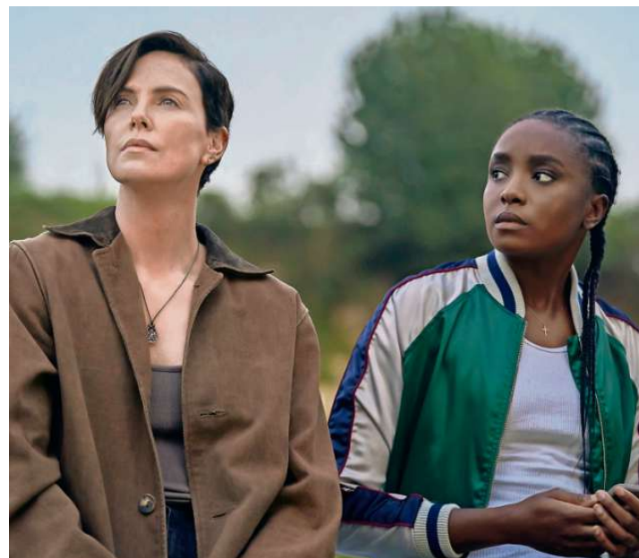
Die Veteranin und ihre Meisterschülerin. Andy (Charlize Theron, li.) erklärt Nile (Kiki Layne) die Vorzüge der Unsterblichkeit.