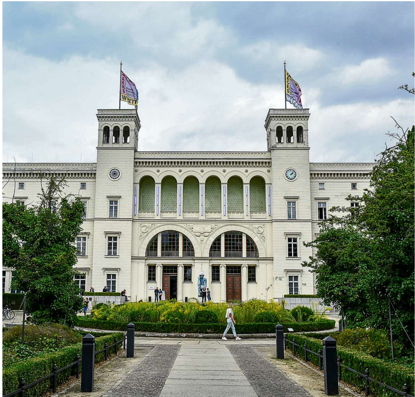
Aufgefallen in Ruinen. Der Hamburger Bahnhof stand einst an der Grenze.

Zeitreise in die 1980er Jahre, als Ruinen schick waren – und eine Immobilienkunde rund um den Hamburger Bahnhof